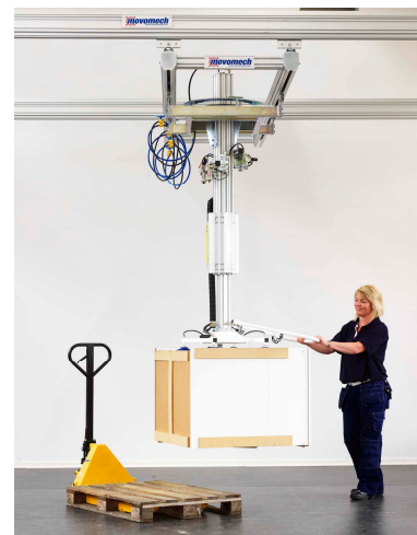
Hantering av större skåp mm.

Vanliga tillämpningsområden för Mechlift är lyft- och hantering av rullar, plåtar, dörrar, fönster, tankar samt allehanda fordonsdetaljer.